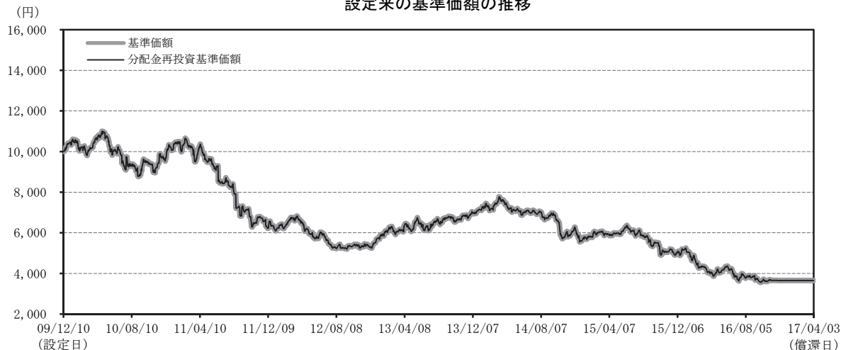
設定来の基準価額の推移

(注) 分配金再投資基準価額は、収益分配金（税込み）を分配時に再投資したものとみなして計算したもので、ファンド運用の実質的なパフォーマンスを示すものです。